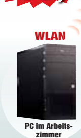
PC im Arbeitszimmer