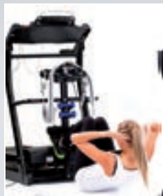
Sit-up-Vorrichtung für Bauchübungen.