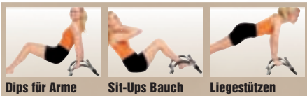
Dips für Arme Sit-Ups Bauch Liegestützen