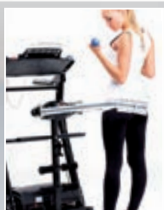
Verwöhnt Sie nach dem Sport mit einer Massage.

Beide Modelle mit Geschwindigkeitsregler am Griff