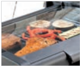
Deckel für optimale Hitzeverteilung