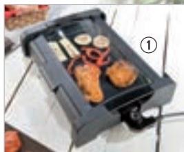
Grillfläche: 34 x 24 cm