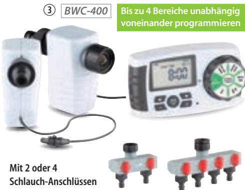
Mit 2 oder 4 Schlauch-Anschlüssen

③ BWC-400 Bis zu 4 Bereiche unabhängig voneinander programmieren