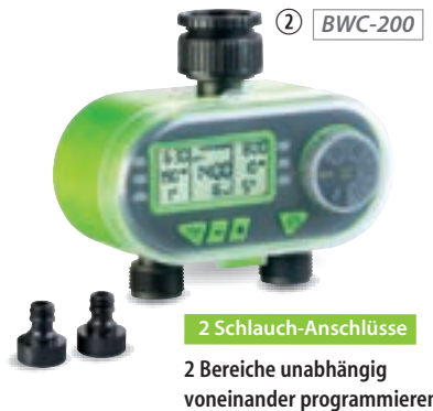
2 Schlauch-Anschlüsse 2 Bereiche unabhängig voneinander programmieren

③ BWC-400 Bis zu 4 Bereiche unabhängig voneinander programmieren